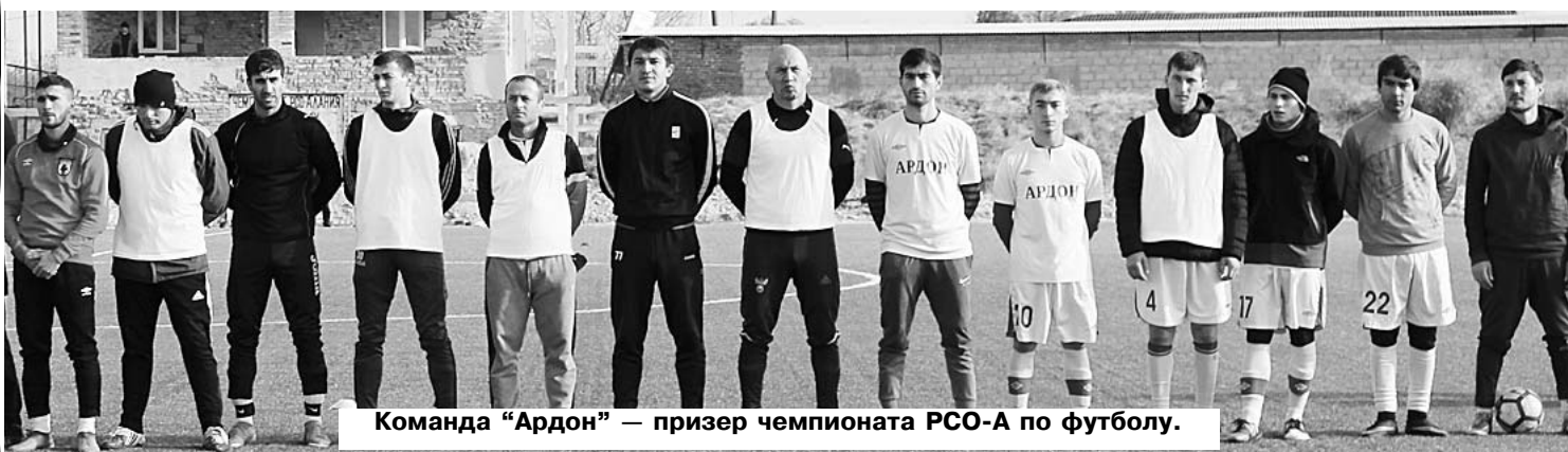
Команда "Ардон" — призер чемпионата РСО-А по футболу.

Следует подчеркнуть, что большую поддержку развитию спорта оказывают АМС района и города. Именно благодаря их слаженной совместной деятельности и успешному руководству эта